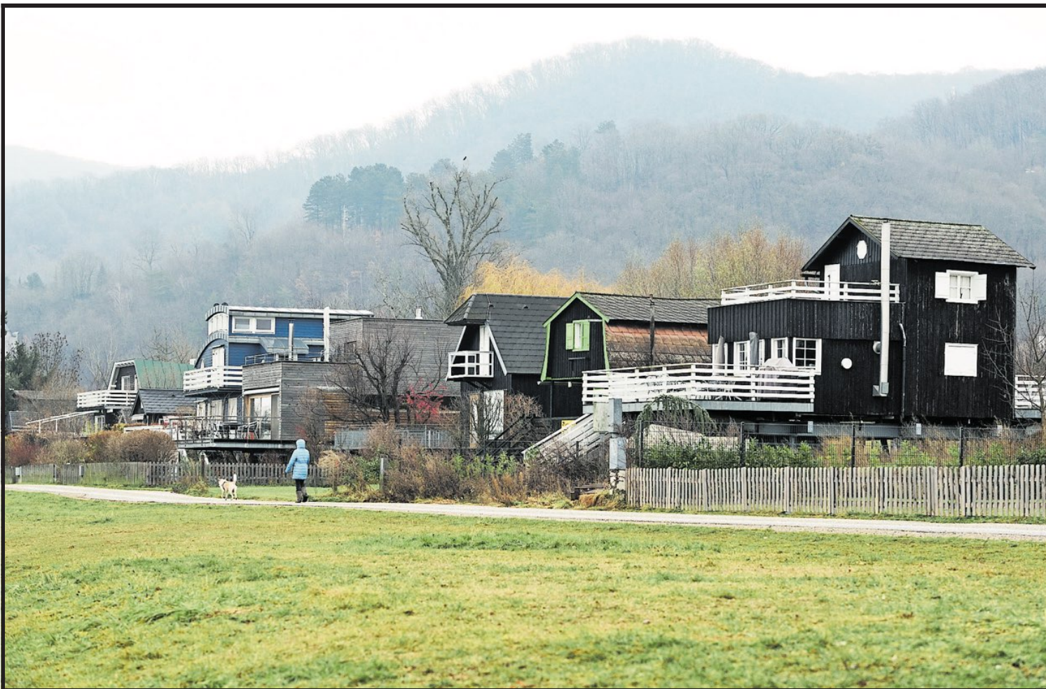
Läuft das Ensemble Am Damm der Badesiedlung Altenberg Gefahr, durch achtlose neue Bauten sein Gesicht zu verlieren?

Mit Rad, Bahn oder Auto bieten sich drei Optionen einer Strecke, um von Wien ans rechte Ufer der Donau zu gelangen: Am Treppelweg stromaufwärts, von Klosterneuburg nach Kritzensdorf und nach Höflein, fädeln sich von Weiden gesäumte Schotterstrände, Auwaldabschnitte und Siedlungen mit Badehütten auf, die ab Beginn des 20. Jahrhunderts errichtet wurden. Nähert man sich Greifenstein, wird das Ufer steinig, und kurz vor dem Altarm weiß man auch, warum: In der Donau erhebt sich eine Staumauer, die sich quer gegen den Strom stemmt, um Strom zu erzeugen. 1985 wurde das Kraftwerk Greifenstein fertiggestellt, ihm hätte das Kraftwerk Hainburg als nächste Staustufe folgen sollen; aber das ist eine andere Geschichte.